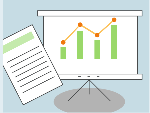
Efterfølgende står du med en solid Vækstplan