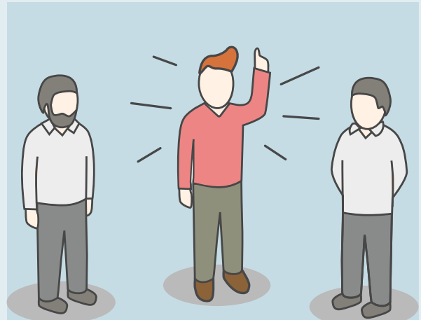
Vælg en prækvalificeret rådgivningspartner