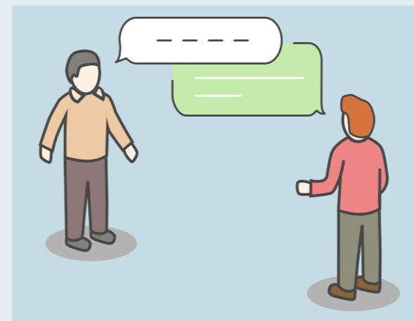
I mødes 20 gange á 2 timer over 10 måneder